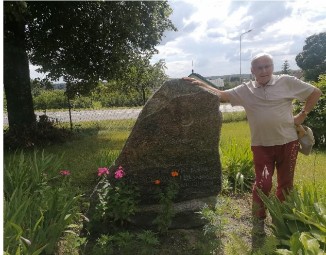
Paminklinis akmuo šalia Keturiasdešimt Totorių kaimo mečetės, minintis totorių persikėlimo į Lietuvą 600-tąjį jubiliejų (2022 rugpjūtis)