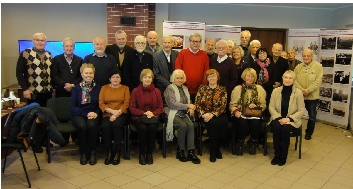
Bendra dalyvių nuotrauka