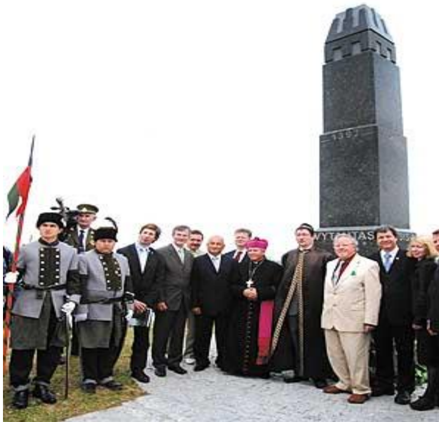
Paminklo Vytautui Didžiajam atidengimas Raižių kaimo totorių bendruomenėje 2012 m. vasarą. Paminkas pastatytas totorių bendruomenės lėšomis. Matome Kaišiadorių vyskupijos vyskupą, totorių muftiją ir EP narį V. Landsbergį