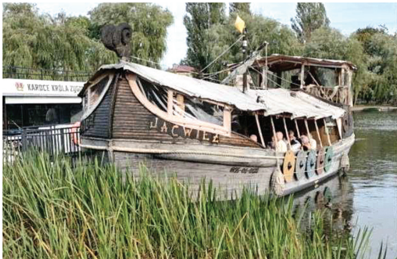
Jotvingių senovinis laivas, kuriuo plaukėme Augustavo kanalu.

Jis jungia Vyslos ir Nemuno upes, jo ilgis apie 100 km, turi 18 šliuzų, dalis jų Baltarusijos teritorijoje. Gidė papasakojo, kad kanalo statyba prasidėjo 1824 m. ir tęsėsi 15 metų. Jo atsiradimą lėmė ekonominės priežastys: Prūsija, kontroliavusi Baltijos pakrantės uostus, ėmė didelius tranzitinius mokesčius javams. Todėl Rusijos imperijos pareigūnai nusprendė, kad verta sujungti Nemuno ir Vyslos baseinus ir laivais pasiekti Latvijos Ventspilio uostą. Tačiau vėliau, pradėjus vystyti geležinkelių tinklui, kanalo laivybinė reikšmė sumenko. Pagal 1920 m. liepos 12 d. Lietuvos ir Tarybų Rusijos taikos sutartį kanalas (taip pat ir Augustavas, Seinai, Punkskas, Vygriai) buvo priskirtas Lietuvos Respublikai. Dabar kanalas naudojamas turistinėms reikmėms. Kitos dienos ryte susipažinome su Augustavu, įkurtu XVI a. ir gavusiu šį vardą dėl Žygimanto Augusto miestui suteiktų Magdeburgo teisių. Po trumpos kelionės pasiekėme Vygrių nacionalinį parką su vaizdingu, didžiuliu Vygrių ežeru, apsuptu miškų žalumos. Tai senosios jotvingių žemės, apgyvendintos nuo VIII a. pr. m. erą. Pasakojama, kad Vygriuose medžiodavo ir kunigaikštis Vytautas, čia jis susitikdavo su Jogaila. Lenkijos karalius ir Lietuvos didysis kunigaikštis Jonas Kazimieras į Vygrius XVII a. pakvietė kamalduliu ordiną. Jam atidavė amži-