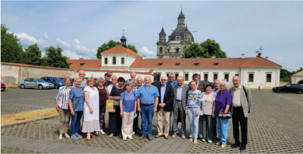
Ekskursijos dalyviai prie Pažaislio vienuolyno ansamblio.

ir ligų gydymą senovėje, vartotų vaistų receptai ir naudotų instrumentų bei vaistinių interjero ekspozicija.