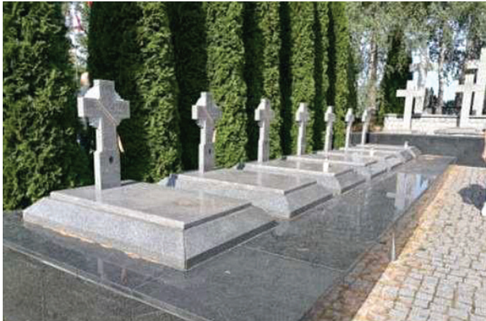
Lietuvos karių savanorių kapai Berznyke.