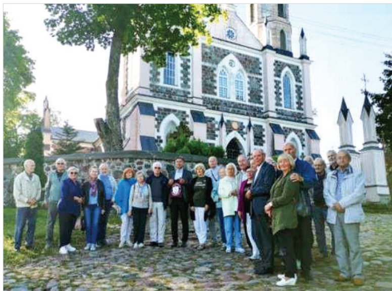
Ekskursijos dalyviai prie Švč. Mergelės Marijos Ėmimo į Dangų bažnyčios Punske.