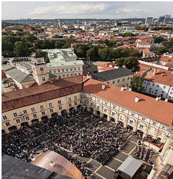
2023 m. rugsėjo pirmoji Vilniaus universitete. Iškilnėse aktyviai dalyvavo ir PE klubo nariai.