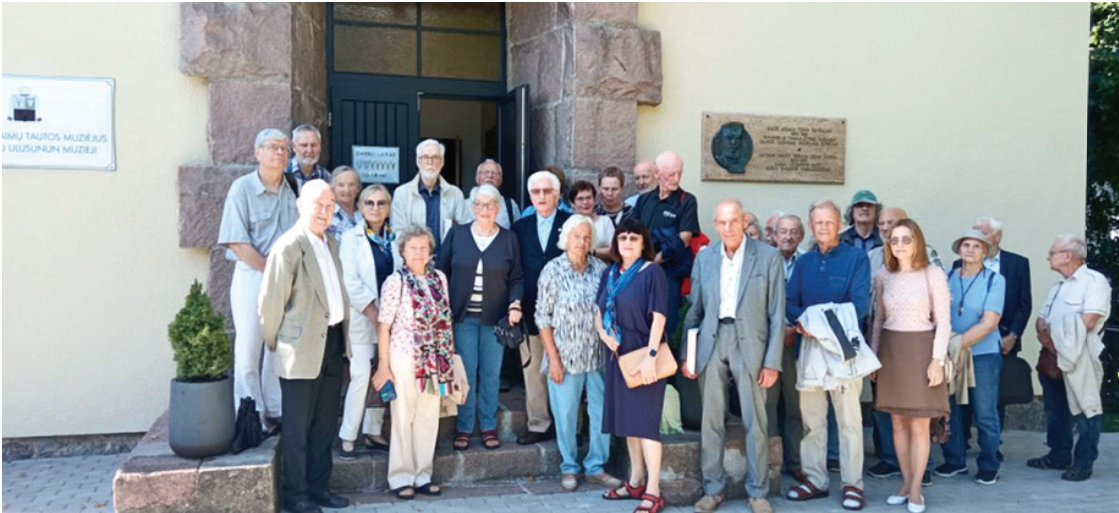
Ekskursijos dalyviai prie H.S.Ch. Šapšalo karaimų tautos muziejaus.