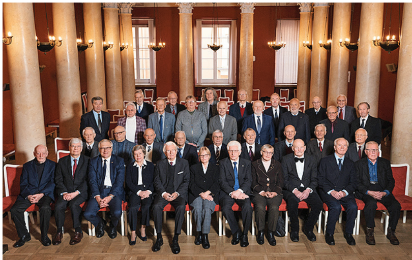
VU profesorių emeritų klubo nariai 2023-11-28.

2023 m. lapkričio 28 d. 11 val. VU Mažojoje auloje klubo nariai susirinko bendrai nuotraukai. Suprantama, kad dėl įvairių svarbių priežasčių (ligos ir kt.) kai kurie klubo nariai negalėjo dalyvauti fotosesijoje. Nepaisant to, absolūti dauguma klubo narių dalyvavo.