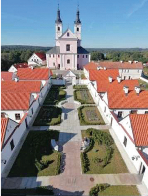
Kamaldulių vienuolyno ansamblis Vygiuose.

nam naudojimui salą su Vytauto Didžiojo medžioklės rūmais, ežerą bei 300 kvadratinį kilometrų žemės plotą. Šiuo metu dalyje Vygrių vienuolyno vyksta renovacijos darbai, eremuose planuojama įrengti svečių nakvynes, restorane – šiuolaikinio meno galeriją bei Jono Pauliaus II biblioteką. Vienuolynė kasmet vyksta kultūriniai renginiai, koncertai. Yra ir popiežiaus vizitą 1999 m. menantys jo poilsio ir darbo kuklūs kambariai.