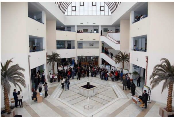
ENU Main Building Atrium