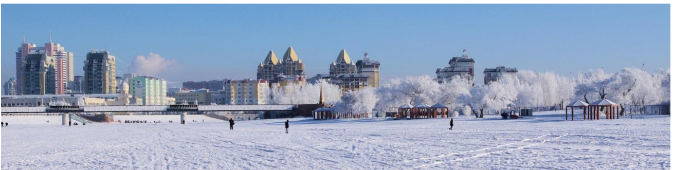
Beautiful Astana in Winter