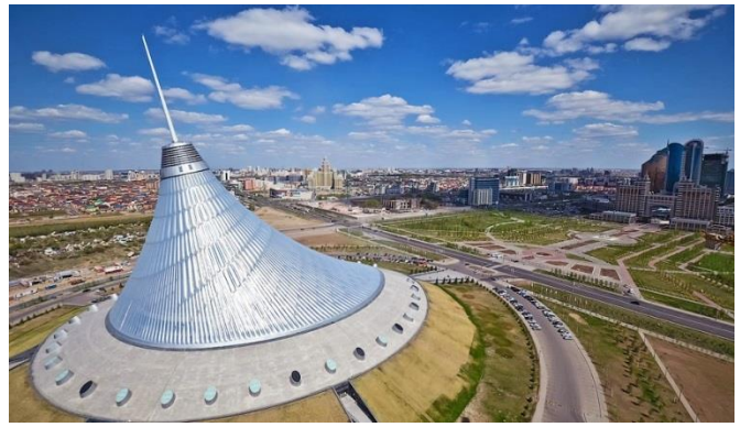
Khan Shatyr Trade Center